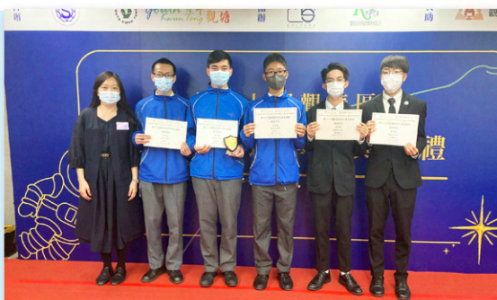
第十七屆觀塘區傑出學生選舉