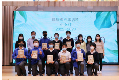
中文演講比賽決賽