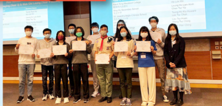
學生領袖訓練及品格培育計劃 2022