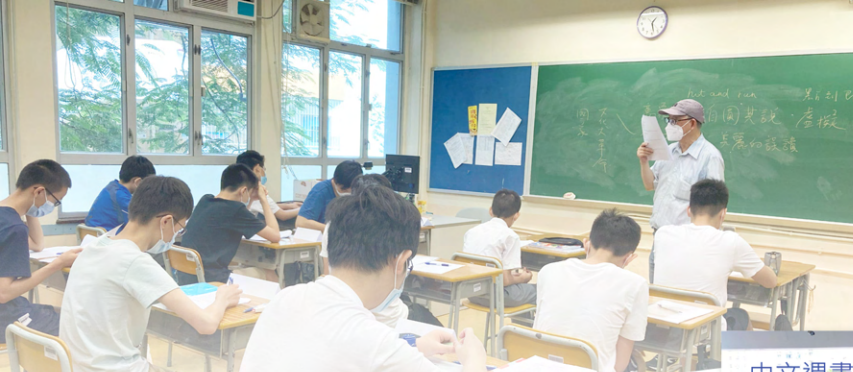
新詩創作班— 詩人關夢南先生